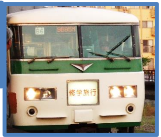
乗り換え無の修学旅行専用列車を利用