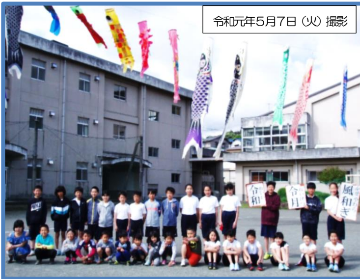
令和元年5月7日(火)撮影

地域の皆様のご協力で、校庭に鯉のぼりがあげられました。色とりどりの鯉のぼりが泳ぐ姿は壮観でした！