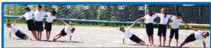
4・5・6年生による 組立体操(練習の様子)