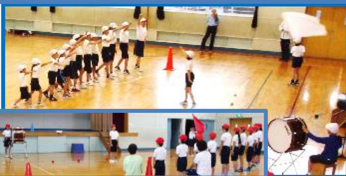
4年生応援団のもと 応援合戦(練習の様子)

この運動会で学んだことを、これからの学校生活に生かしていけるよう、日々の教育活動のさらなる充実をめざしていきます。