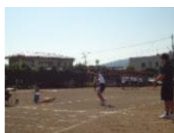
女子フットボール投げ