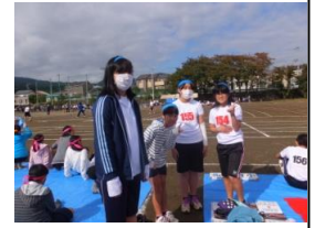
個人種目に、リレーに、応援に、それぞれにがんばった陸上大会